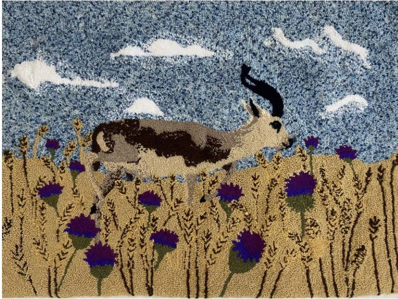
Görsel 2. Ö2 / Tuval üzerine punch tekniği

Buradan hareketle çalışmada Şanlıurfa’yı temsil ettiği düşünülerek seçilen Göbeklitepe’nin punch tekniği ile ifadesinin öğrenciyi zorlasa da sonucun heyecan ve mutluluk verici olarak nitelendirildiği, alan uzmanları görüşlerine bakıldığında ise estetik açıdan ve renk geçişleri bakımından başarılı, kompozisyon açısından bütünsel ve özgün, teknik açıdan ise geleneksele bir gönderme yaptığından dolayı ise uygun olarak ifade edilmiştir.