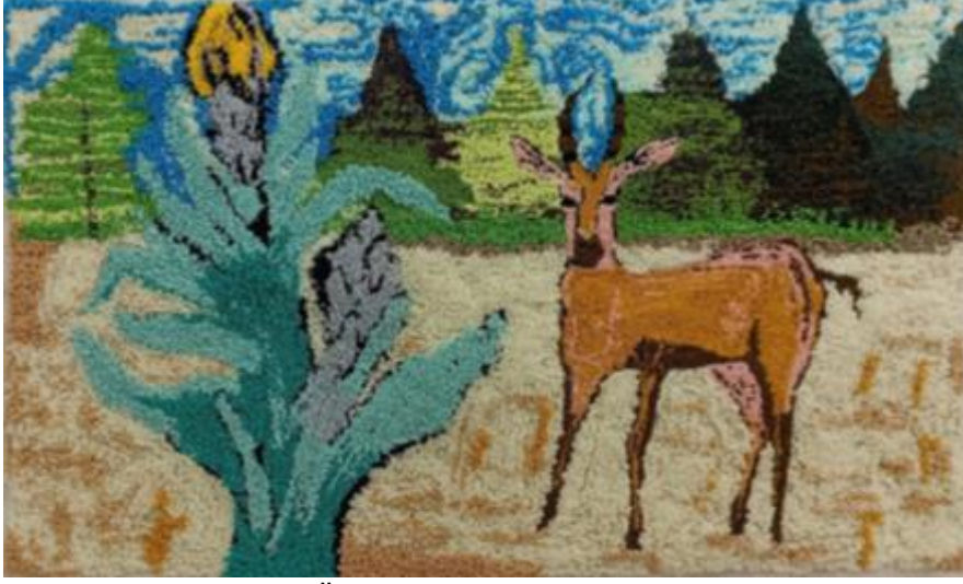
Görsel 10. Ö10 / Tuval üzerine punch tekniği

Görsel 10'da tasarımını gördüğümüz Ö10'nun projeye yönelik görüşleri şu şekilde olmuştur; "Tekstil materyalleri ile tuval çalışması ilginç bir deneyim oldu. İlk kez deneyimlediğim punch tekniği oldukça zor olmasına rağmen proje kapsamında oluşturduğumuz deseni görsel olarak tuvalde görmek güzeldi. Desen derslerinden alışık olduğumuz teknikleri farklı renkteki ipliklerle tuvale yansıtmak ve sonucunda bir tekniği başarma hissiyatı benim acımdan mükemmeldi. Ayrıca proje kapsamında ele aldığımız konu yaşadığımız şehrin farklı yönlerini görmemizi de sağlamış oldu."