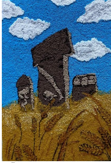
Görsel 15. Ö15 / Tuval üzerine punch tekniği

Görsel 15’de tasarımını gördüğümüz Ö15’in projeye yönelik görüşleri şu şekilde olmuştur; “Punch nakışına başlarken öncesinde çok zorlandım pratiğe döktükçe sabır gerektiren bir iş olduğunu anladım. Punch’ı işlerken stresimi atıyordum. Uzun süren bir iş ve genelde sonuç odaklı çalıştığım için bazen sıkıldığımı söyleyebilirim. Bitmiş olan çalışmamdan ve süreçteki kazanımlarımdan oldukça mutluyum.”