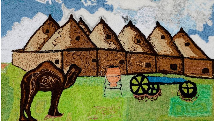
Görsel 3. Ö3 / Tuval üzerine punch tekniği

Buradan hareketle; öğrencinin alışkın olduğu ve kullandığı malzemeler dışında uyguladığı tekstil teknikleriyle el becerilerini artırarak yeni bir perspektif oluşturduğu, alan uzmanları görüşlerine göre ise; Şanlıurfa'ya has bir değer olarak ceylanın seçilmiş olmasının tasvir açısından özgün ve kavramsal olarak ifade edildiği, seçilen renklerin hareket ve ritimsel olarak yansıtılmasının estetik ve birbirini tamamlar nitelikte olduğu, kompozisyon açısından ise detayların iyi verildiği ancak zemin figür ilişkisinde ton olarak yakın kullanılan renklerin algıyı zorlaştırdığı, teknik açıdan ise başarılı olarak ifade edilmiştir.