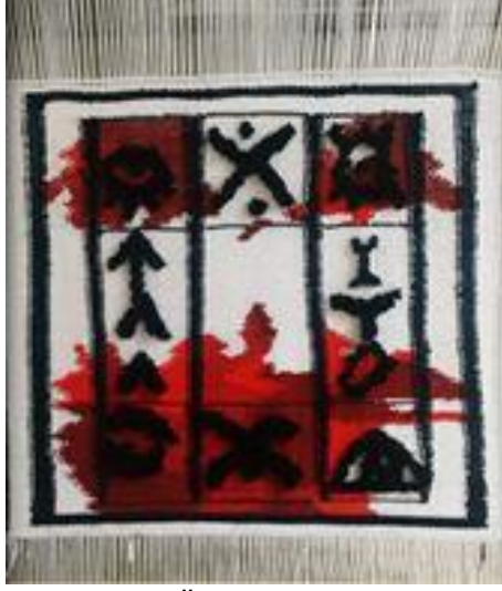
Görsel 8. Ö8 / Dokuma tekniği

Görsel 8’de tasarımını gördüğümüz Ö8’in projeye yönelik görüşleri şu şekilde olmuştur; “2023 Yılı İslam Dünyası Turizm Şehri Şanlıurfa başlıklı projede kentteki dövme kültürünü inceledim. Bu yöreye ait simgesel bir dili olan dövmeleri kilim dokuma tekniği ile gerçekleştirdim. Teknik oldukça zor olmasına rağmen eğitim sürecinde edindiğim desen ve renk algısı çerçevesinde çalışmamı resmetmiş oldum. Kente dair başka bir perspektiften bakmaya çalıştığım konumu severek bitirdim.”