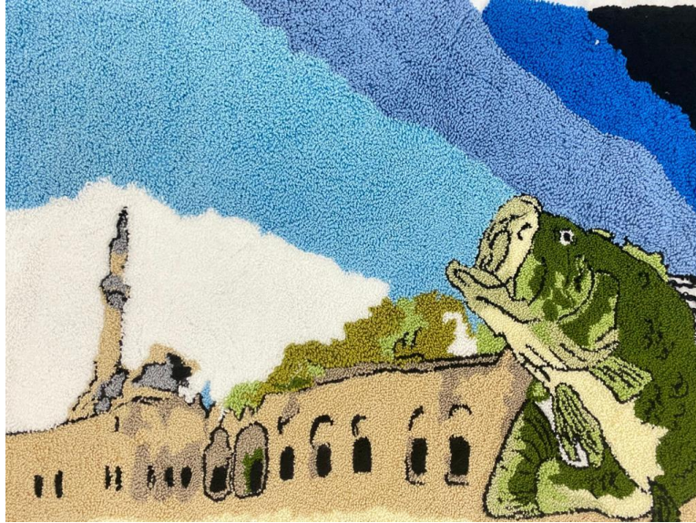
Görsel 4. Ö4 / Tuval üzerine punch tekniği.

Buradan hareketle; öğrencinin uyguladığı teknik sayesinde ortaya çıkardığı ürünle farklı bir bakış açısı kazandığı, uzman görüşlerine bakıldığında ise; kompozisyon bağlamında iyi, renkler açısından yeterli, teknik açısından uygun bulunmuş, detaylara bakıldığında ise gökyüzünün derinliği, konik evler ve figürlerin başarılı yansıtıldığı ancak renk geçişlerinin geliştirilebilir olduğu da ifade edilmiştir.