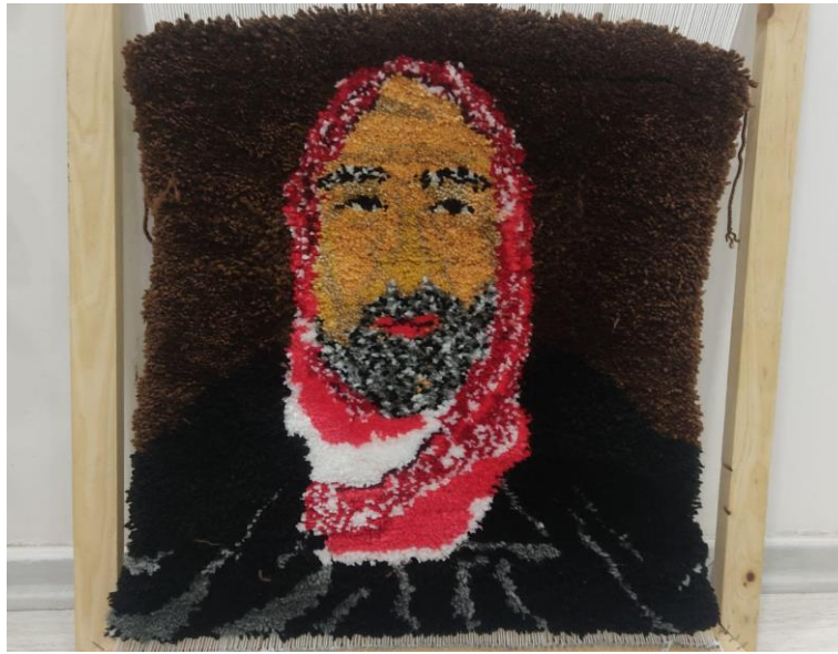
Görsel 6. Ö6/ Dokuma tekniği

Buradan hareketle öğrencinin Şanlıurfa kentini nesli tükenmekte olan Kelaynak figürleriyle ifade etmeye çalıştığı, çalışma sürecini ise başlangıçta zor sonrasında keyifli ve gelecekte kendisine katkısı olacağını düşündüğü şekilde ifade etmektedir. Alan uzmanlarının görüşlerine bakıldığında ise; özellikle tekniğin hem resimsel hem de tekstil anlamında oldukça başarılı bir anlatım olduğu vurgulanmıştır.