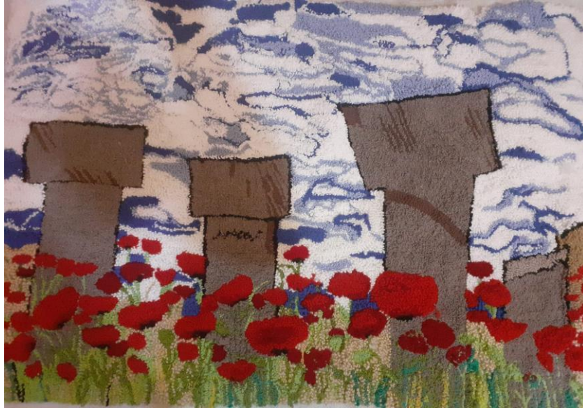
Görsel 1. Ö1 / Tuval üzerine punch tekniği.

Araştırmanın bu bölümünde görsel veri olarak kullanılan “2023 Yılı İslam Dünyası Turizm Şehri Şanlıurfa” temasında tuval üzerine tekstil üretim yöntemleri ile hazırlanmış öğrenci çalışmalarına, alan uzmanlarının değerlendirmelerine ve öğrencilerin bu proje kapsamında yapmış oldukları disiplinlerarası çalışmalarına yönelik görüşlerine yer verilmiştir.