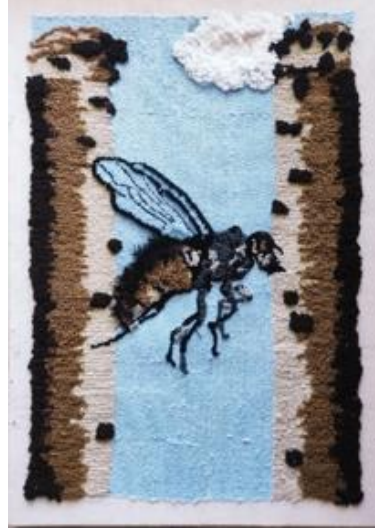
Görsel 9. Ö9 / Tuval üzerine punch tekniği

Görsel 9’da tasarımını gördüğümüz Ö9’un projeye yönelik görüşleri şu şekilde olmuştur; “Ders kapsamında yürütülen projede konu olarak balıklıgöl hikâyelerini araştırdım. Desenimi oluşturduktan sonra kullanacağım tekniğin denemelerini çalıştım. Teknik zor olmasına rağmen seçtiğim renk tonları ile resimsel bir anlatım yakalamaya çalıştım. Oldukça zorlandığım bu teknikle başka çalışmalar yapılabileceğini görmüş oldum.”