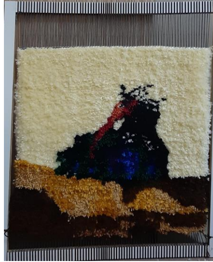
Görsel 7. Ö7/ Dokuma tekniği

Buradan hareketle; öğrencinin dokuma teknikleri çalışmasında; renk geçişleri, form fon ilişkisi ve rölyefsi etkiler bağlamında birçok kazanım sağladığı anlaşılmakta, alan uzmanları görüşlerine bakıldığında ise; renklerin iyi seçildiği, konuya uygun olduğu, insan figürü detaylarının dokuma tekniğinin zorluklarına rağmen kısmen çözümlendiği ifade edilmiştir.