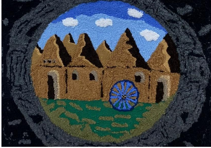
Görsel 13. Ö13/ Tuval üzerine punch tekniği

Görsel 13’de tasarımını gördüğümüz öğrencinin projeye yönelik görüşleri şu şekilde olmuştur; “Resim iş öğretmenliği eğitimi içerisinde punch tekniği ile tekstil sanatını deneyimlediğim için çok mutluyum. Resim gereçleri dışında farklı malzemelerle tasarımlar oluşturmak ilginç bir deneyim oldu. Ancak tekniğin zorluğu başlangıçta üzerimde büyük bir baskı oluşturdu. Tüm yorgunluk ve zorluklarla bütünleşerek ortaya çıkan eserimle gurur duyuyorum.”