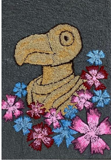
Görsel 14. Ö14 / Tuval üzerine punch tekniği

Görsel 14’de tasarımını gördüğümüz öğrencinin projeye yönelik görüşleri şu şekilde olmuştur; “ Punch yapımına başlarken biraz önyargılı ve isteksizdim. Zamanla önyargım kırıldı ve tekniği sabırla uygulamam gerektiğini anladım. Başka malzemelere dokunmak, renkler arsında bu malzemelerle geçişler yapmak farklı bakış açıları geliştirmeme neden oldu. Süreç benim için zorlu geçse de sonuçtan memnunum.”