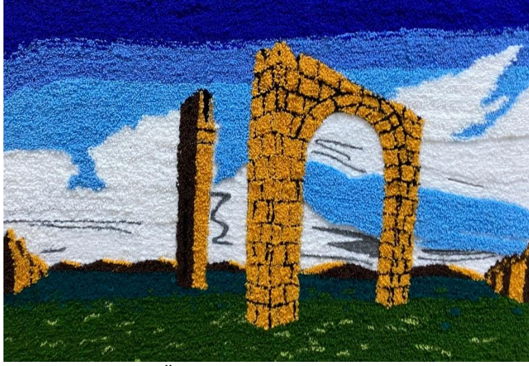
Görsel 12. Ö12 / Tuval üzerine punch tekniği

Görsel 12’de tasarımını gördüğümüz Ö12’nin projeye yönelik görüşleri şu şekilde olmuştur; “Tekstil materyalleriyle böyle bir projede tasarım yapmak ilginç bir deneyim oldu. İlk kez deneyimlediğim punch tekniği benim açımdan oldukça zor oldu. Eğitim boyunca edindiğimiz resimsel anlatımları farklı bir alana ait malzemelerle aktarmak, malzemedен bağımsız tasarımlar yapabilmek açısından bakış açımı değiştirdi.”